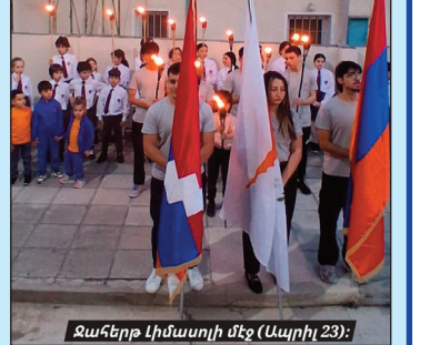
Ջահերթ Լիմասոլի մէջ (Ապրիլ 23)