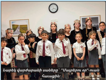
Նարեկ վարժարանի սաները՝ «Մայրերու տօն»-ի համալիրը:

ԼԻՄԱՍՈՒՆ Ս. Գեորգ եկեղեցւոյ սրահին մէջ, 16 Մայիսի երեկոյեան, մեծ թիւով ընտանիքներ մէկտեղուած են յարգարեալ սեղաններու շուրջ եւ ընկերային հաւաքով մը նշած են «Մայրերու տօն»-ը: Ձեռնարկը կազմակերպուած է եկեղեցւոյ թաղականութեան կողմէ: Հաճելի հաւաքը զգեցած է միաժամանակ զեկուցական ընտրութեան քննարկները մտայնութեամբ: Նարեկ վարժարանի աշակերտները մասնակցութիւն բերած են ծանօտացումը: Յարցազրոյցները մասին բանախօսութեամբ մը անդէս եկած է Սիմոն Այնեճեան: Օրուան գլխաւոր բանախօսը (հայերէնով) հանդիսացեր է Պելրինէն հրապարակած երկուստար յայտարարի մը՝ ճոնաթան Շպակեանի (Այնճարի Հայ Աւետ. երկր. վարժարանի երբեմնի սան), որ ներկայիս Գերմանահայոց կեդրոնական խորհուրդի նախագահն է: Հոսկ, թեմի կաթողիկոսական փոխանորդին գրաւոր պատգամը ընթերցած է Մաշտոց աւ. քին. Ազգարեան: Գիշերը, մարզադաշտի սրահին մէջ տեղի ունեցած է խրախմանք՝ երգիչ Դազար Քեօշկերեանի մասնակցութեամբ: