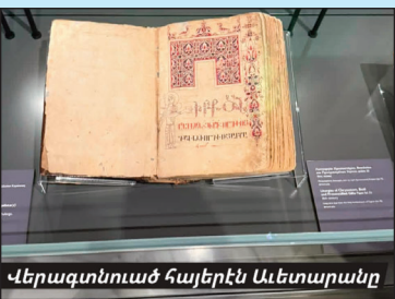
Վերագտնուած հայերէն Աւետարանը

Մեծարեցի մասին կը բանախօսէ Տ. Արապաթեան: Երգ ու ամուսնէ բաղկացած պատշաճ յայտագրի մը առընթեր՝ բաւաստեղծին մասին բանախօսութեամբ մը հանդէս եկած է հայերէնաւանդ երիտասարդ ուսուցիչ ճորճ Արապաթեան, որ Զուլթէն հեռանալէ ետք՝ այժմ հաստատուած է Կիպրոս: Երեկոյթի ընթացքին մատուցուած է գինի ու թեթեւ ընթրիք: Ինչպէս ծանօթ է, Մեծարեցի ճիշդ Դուրեանի նման գոհ գնաց թեւախտի, 22 տարեկանին: Ակնայ Բինկեան գիղէն կու գար: Ծնողաց հետ փոխադրուած էր Պոլիս ու շրջան մը յաճախած Կեդրոնական վարժարան: Բնութեանապաշտ ու գերզգայուն բանաստեղծ մըն էր, որ մահէն տարի մը առաջ՝ 1907-ին, կրցաւ հրատարակել քերթուածներու երկու գիրքեր՝ «Ծիածան» եւ «Նոր տաղեր», արտակարգօրէն գեղատուն ու ինքնատիպ բովանդակութեամբ: Այդ օրերուն շատեր չհասկցան գինը, չկրցան ճանչնալ իր տաղանդին մեծութիւնը: Յաջորդող տասնամեակները, սակայն, դափնեպսակներ դրին իր գլխուն: