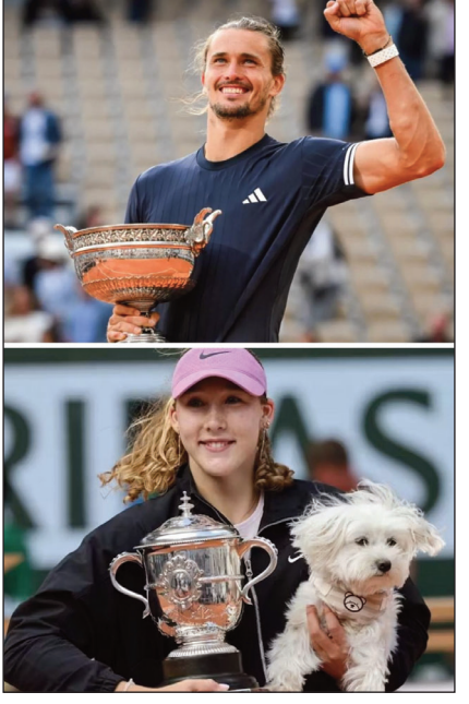
Պատրաստեց՝ ՍՈՒՐԱՍ Ս.

2026-ի «Ռոլան Կարոս»-ի մէջ, Փարիզ, նոր պիտաններ յայտնաբերուեցան: Տղամարդոց աւարտական խաղին Ալեքսանտր Զվերեվը իր առաջին «Կրան Սլամ»-ը նուաճեց՝ յաղթելով Ֆլավիո Զոպոլիին՝ 6-1, 4-6, 6-4, 6-7(5), 6-1 արդիւնքով: Կանանց խաղերուն եւս, Միրա Անտրեբեի իր առաջին «Կրան Սլամ»-ը նուաճեց աւարտական խաղին յաղթելով Լեա Մայա Խուալիսկային՝ 6-3, 6-2 արդիւնքով: Այս մրցաշարը վճռորոշ պահ մըն երկու պիտաններուն համար՝ շեշտելով թենիսի նոր սերունդի ծագումը: