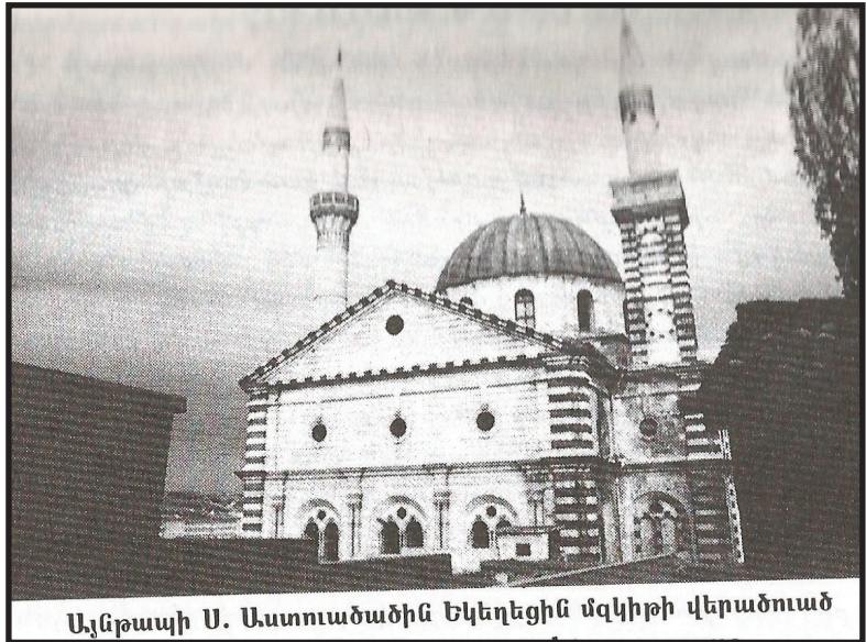
Ալեքսանդր Ս. Աստուածածին եկեղեցին մզկիթի վերածում