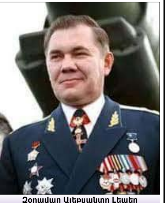
Չորավար Ալեքսանտր Լեպեր

1998-ի Սեպտեմբեր 2-4 ժամանակաշրջանին, Արցախ աշխարհ պայրեցան փառաւոր օրեր: Մայր Զայրենիքէն լրագրողներու մեծ պատուիրակութիւն մը ճամբայ ինկանք հանրակառքով դէպի ազատատենչ Ստեփանակերտ: Զոն էին արդէն ոչ միայն Զայաստանի Ազգային ժողովի պատգամաւորներ, նաեւ հայ ժողովուրդի փառապան ռուս գաւակներ՝ Չորավար Ալեքսանտր Լեպեր, որ իր որոտընդոտ ձայնով յայտարարեց ի լուր աշխարհին, թէ Լեռնային Ղարաբաղը երբեք Ատրպէյճանի մաս չէ կազմած, այլեւ՝ Խ. Միութեան... Փառաւոր ելոյթ ունեցաւ Ռուսիոյ պետական Տումայի փոխնախագահ, Արցախի մեծ բարեկամ Կոնստանթին Չարոյին: Վերածնունդի հրապարակին վրայ գտնուող պատուանդանի վրայ կանգնած էին հայ ժողովուրդի միաբանուած հերոս ղեկավարները, գլխաւորութեամբ նահատակ սպարապետ Վազգէն Սարգսեանի, նախագահ Ռուպերթ Զոչարեանի, պաշտպանութեան նախարարներ Սամուէլ Պապայեանի եւ Սերժ Սարգսեանի: