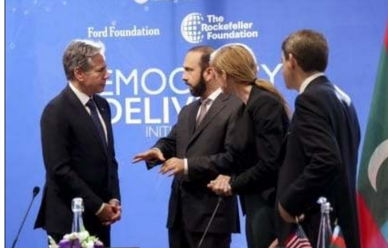
Միացեալ Նահանգներու արտաքին գործերու նախարար Անթոնի Պլինքըն Ռուսաստանի վարչապետ Նիկոլ Փա-

Նշենք, որ Արցախի տեղեկատուական գրասենեակը քաղաքայիններուն յորդորած էր ինքնուրոյն չուղղուիլ ռուս խաղաղապահներու կեդրոնատեղի, այլ մնալ ապաստաններուն մէջ՝ խուսափելու համար հաւանական վտանգներէն: