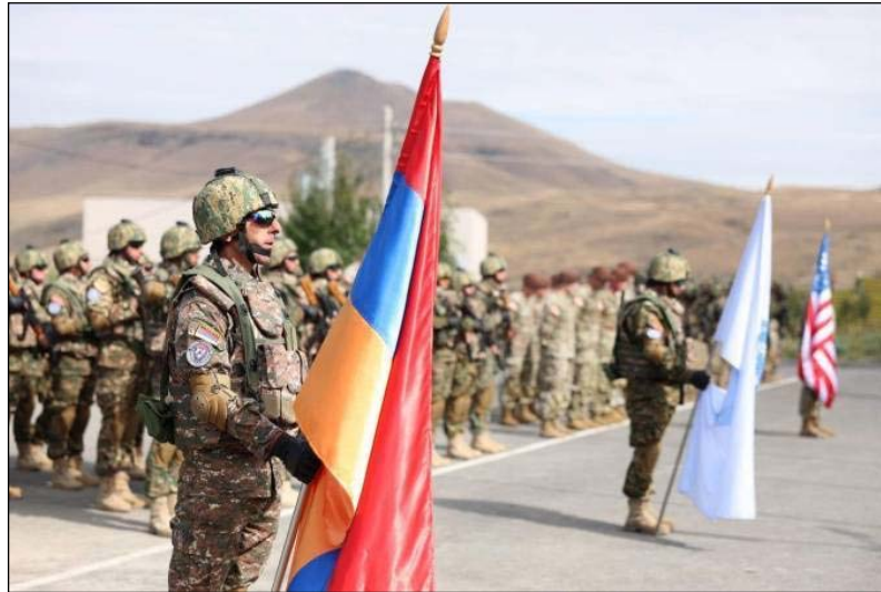
Անոր խօսքով՝ «Արծիւ Գործընկեր-2023» տասնօրեայ զորավարժություններու ժամանակացույցին մեջ փոփոխություններ չեն եղած:

ԱՄՆ զինուորները հայկական զորքերուն հետ համատեղ զորավարժությունները անարտադրելի են 20 Սեպտեմբերին, ինչպես էլ ի սկզբանե նախատեսված էր, Լեռնային Ղարաբաղի մեջ Ատրպեյճանի ծախսած ռազմական գործողությունները չեն ազդած անոր ընթացքին վրայ: Այս մասին «Ռոյթերզ»-ին յայտնած է ԱՄՆ զինուած ուժերու ներկայացուցիչներն մեկը: