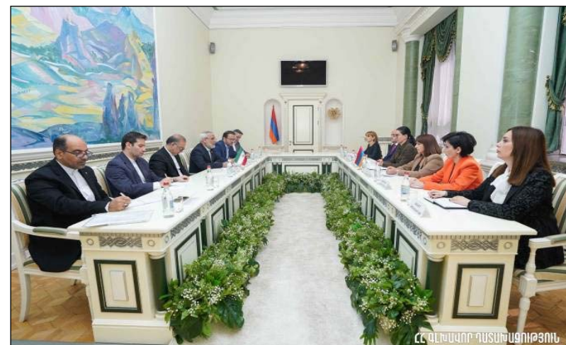
Հանդիպման ընթացքին անդրադարձ կատարուած է օրակարգային շարք մը հարցերու:

շնած է, որ Իրանը մտահոգուած է ստեղծուած իրավիճակով եւ ընդգծած է, որ Իրանի ջանքերը ուղղուած են տարածաշրջանին մէջ խաղաղութեան ապահովման ու ամրապնդման: