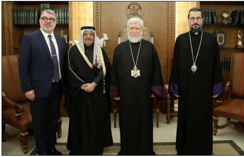
լաուի այցելութիւնը: Զանդիպան ներկայ էին Միացեալ Արաբական Եմիրութեանց, Զաթարի եւ Օմանի թեմի առաջնորդ Գերշ. Տ. Մետրոպ Եպս. Սարգիսեան եւ Ազգային Կեդրոնական Վարչութեան համա-ատենապետ Գրիգոր Մահերեմեան:

Չորեքշաբթի, 1 Փետրուար 2023-ի յետմիջօրէին, Ն.Ս.Օ.Տ.Տ. Արամ Ա. Վեհափառ Յայրապետը ընդունեց Զաթարի նորանշանակ դեսպան Իպրահիմ Պըն Ապտ Ալ-Ազիզ Սահ-