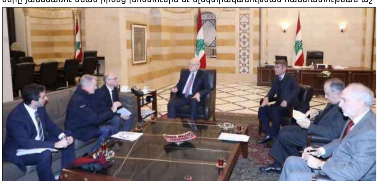
Ֆրանսայի ելեկտրականութեան պատուիրակութեան անդամները (ձախ) և Նաժիպ Միքաթիի (աջ) հարցազրույցի ժամանակ:

Նաժիպ Միքաթիի հետ, ընկերակցութեամբ Ֆրանսայի ելեկտրականութեան հաստատութեան պատուիրակութեան մը: Ֆայյատ մարդեց, որ բանակն ու ապահովական կառույցները յանձնառու մնան իրենց խոստումին եւ ելեկտրականութեան հաստատութեան աշխատակիցներուն օժանդակելն վերացնել ցանցին նկատմամբ գործադրուած ոտնձգութիւնները: Ըստ Ֆայյատի, հաստատութիւնը առայժմ պիտի արտադրէ միայն 250 մեկաուաթ ելեկտրականութիւն, սակայն եթէ ոտնձգութիւնները վերանան, ապա կարելի պիտի ըլլայ ելեկտրականութիւնը հասցնել մինչեւ 300 մեկաուաթի: