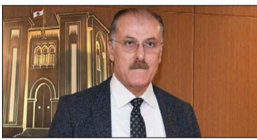
(Շաբ.ը տեսնել Չոր. էջ)

Առողջապահութեան հարցերու խորհրդարանական մնայուն յանձնաժողովի Նախագահ Երեսփոխան Պիլալ Ապտալա յայտնեց, որ յանձնաժողովը կառավարութեան խորհուրդ տուած է յայտարարել առող-